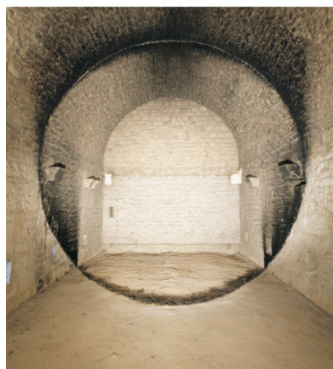
Soissons 1 © Georges Rousse